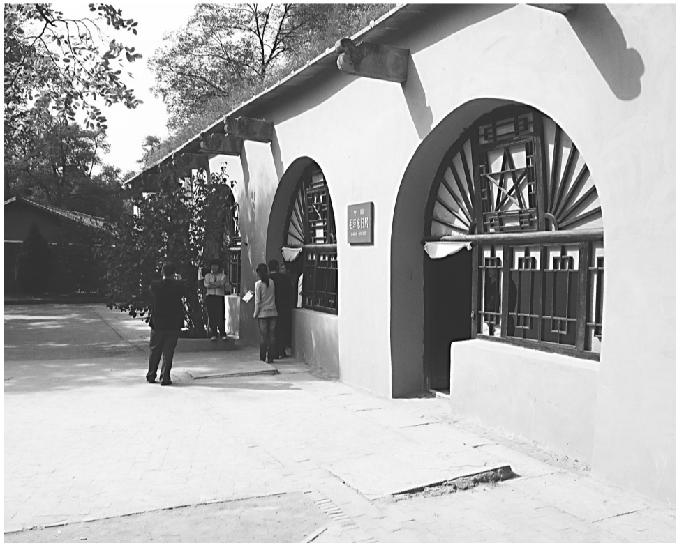
延安枣园 毛泽东同志故居