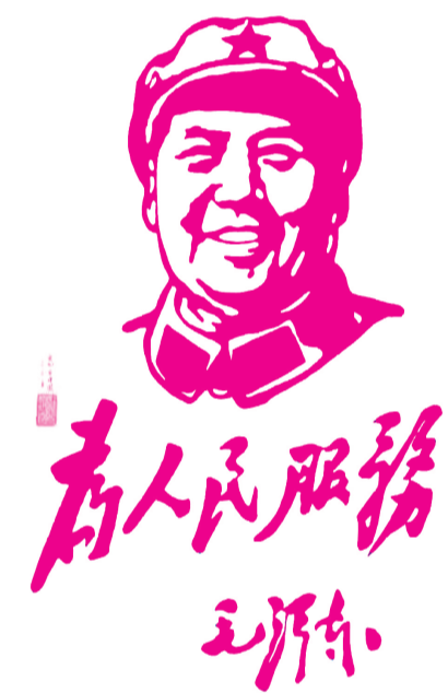
剪纸 宋建国 剪 (作者单位:张家口市宣化区交警大队)