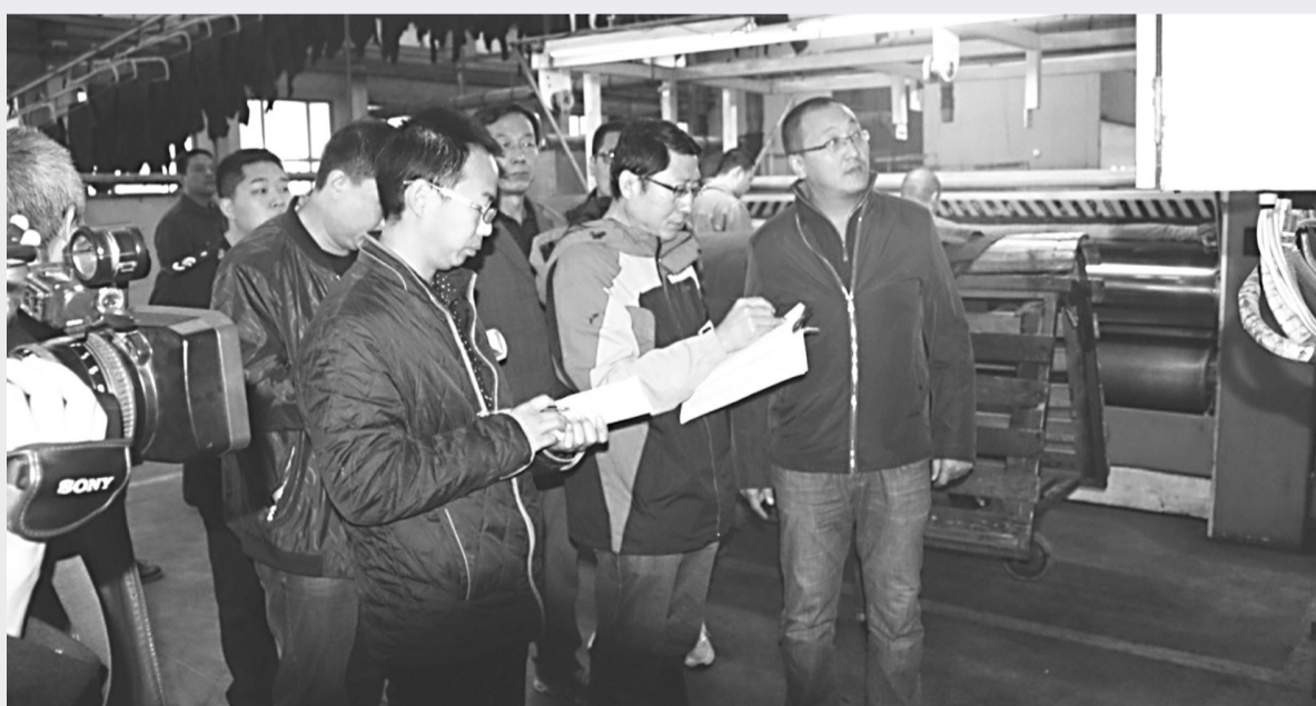
近日,省安监局监察总队二处同辛集市安监局监察执法大队在辛集市制革工作区举办制革业观摩执法现场会。来自辛集市制革工业区十家大型制革企业的主管安全生产的经理和安监部部长参加了会议。观摩会邀请了省安全生产专家库的两名专家分别带领与会人员进行详细查看了企业安全生产制度和台账,到车间、库房、配电室、污水处理现场查找隐患,对存在的问题进行了现场讲评。