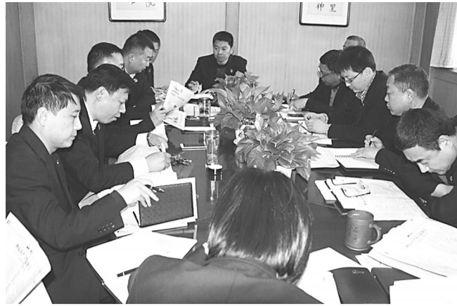
石家庄铁路运输法院党组按照省委、省纪委部署要求,迅速掀起学习、宣传、贯彻党的十八届六中全会精神热潮。大家表示,要切实增强思想自觉和行动自觉,以高度的责任感和使命感,积极营造风清气正的工作氛围,确保全年工作任务圆满完成。图为11月14日,该院组织干警认真学习全会精神。

民警随即展开审讯工作,在强大的心理攻势下,犯罪嫌疑人刁某如实交代了自去年以来,先后多次在天津、廊坊等地购买毒品后在青县销售及吸食的事实。犯罪嫌疑人尚某也交代了自今年10月份以来,多次替刁某销售毒品及吸毒的犯罪事实。吸毒人员张某、杨某则分别对伙同刁某等人多次吸食毒品的违法事实供认不讳。据了解,目前徐宪身体已基本恢复良好,重新回到了工作岗位。