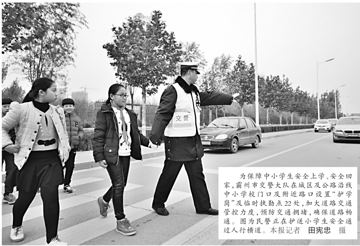
为保障中小学生学习安全、安全回家,霸州市交警大队在城区及公路沿线中小学门口及附近路口设置“护学岗”及临时执勤点22处,加大道路交通管控力度,预防交通拥堵,确保道路畅通。图为民警正在护送小学生安全通过人行横道。

在此,石家庄市公安局、教育局温馨提示广大外来务工人员,如果随迁子女2017年选择在石家庄入学接受义务教育,请您务必于今年11月底前携身份证(或户口簿)、两张免冠一寸照片、居住地址证明等相关材料,到居住地公安派出所申报居住登记,以便您能够在2017年5月31日前凭合法稳定就业、合法稳定住所、连续就读等三个条件之一的材料申领取得居住证,确保子女顺利入学。