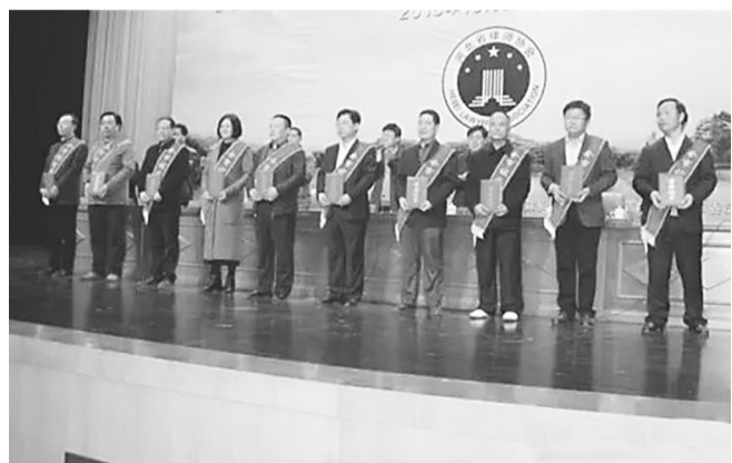
图为受表彰的律师。

认真学习党的路线、方针、政策,学习国家的法律法规,学习法学理论和专业知识,不断提高自身的法律素质和专业素质,在律师执业实践中增强专业本领和执业技能。三是讲诚信。诚信是行业发展的基石,律师要增强诚信意识,坚持诚信执业,勤勉尽责地维护当事人的合法权益,维护司法公正。四是尽义务。广大律师要认真履行法律援助义务,积极参与社会矛盾化解和信访工作,要带头积极参加志愿服务,主动承担社会责任,热诚关爱他人,多做扶贫济困、扶弱助残的实事好事,以实际行动促进社会进步。五是树品牌。通过各种渠道和方式宣传自己,让广大群众了解律师,支持律师工作,树立律师队伍良好社会形象,打造衡水的品牌律师事务所和品牌律师。