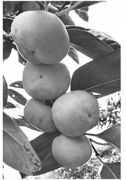
小水村的柿子树硕果累累。

爱国情怀,是一个民族存在、发展、壮大,走向辉煌的火种!每一位华夏儿女、炎黄子孙,都要自觉树立和坚持正确的历史观、民族观、国家观、文化观;自觉增强中华民族的归属感、认同感、尊严感、荣誉感;自觉坚持道路自信、理论自信、制度自信、文化自信;自觉增强爱国精神,履行爱国责任,践行爱国行动,为实现中华民族伟大复兴的中国梦提供精神支柱和强大精神动力。 我为你点赞!质朴的爱国情怀。