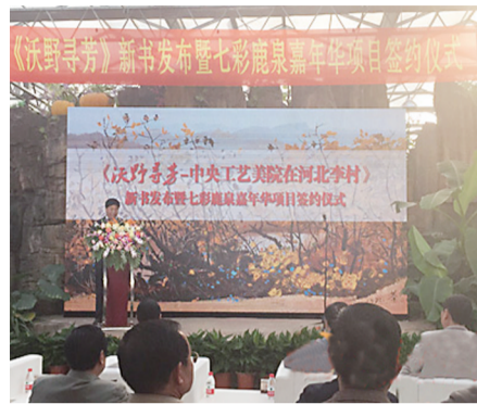
《沃野寻芳——中央工艺美院在河北李村》新书发布会现场。

本报讯 (杨欣月)近日,长篇纪实文学《沃野寻芳——中央工艺美院在河北李村》新书发布会在石家庄市鹿泉区举行。