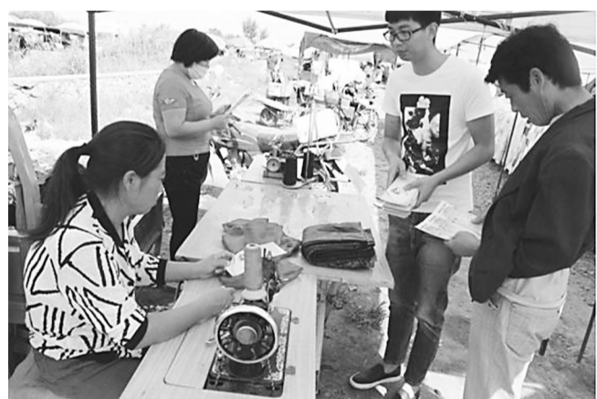
唐山海港经济开发区计生协会日前组织开展了关爱女孩专题活动。该协会工作人员深入群众中间,发放宣传资料、计生用品,开展宣传教育,促使群众树立起“生男生女一样好,女儿也是传后人”的科学文明的生育观念。

秦皇岛市海港区网格建设满足了群众个性化、多样化的需求,变被动应付为主动服务,使管理工作更加精细化,提升了全区群众的满意度和幸福指数,成为全市网格化建设的典型。