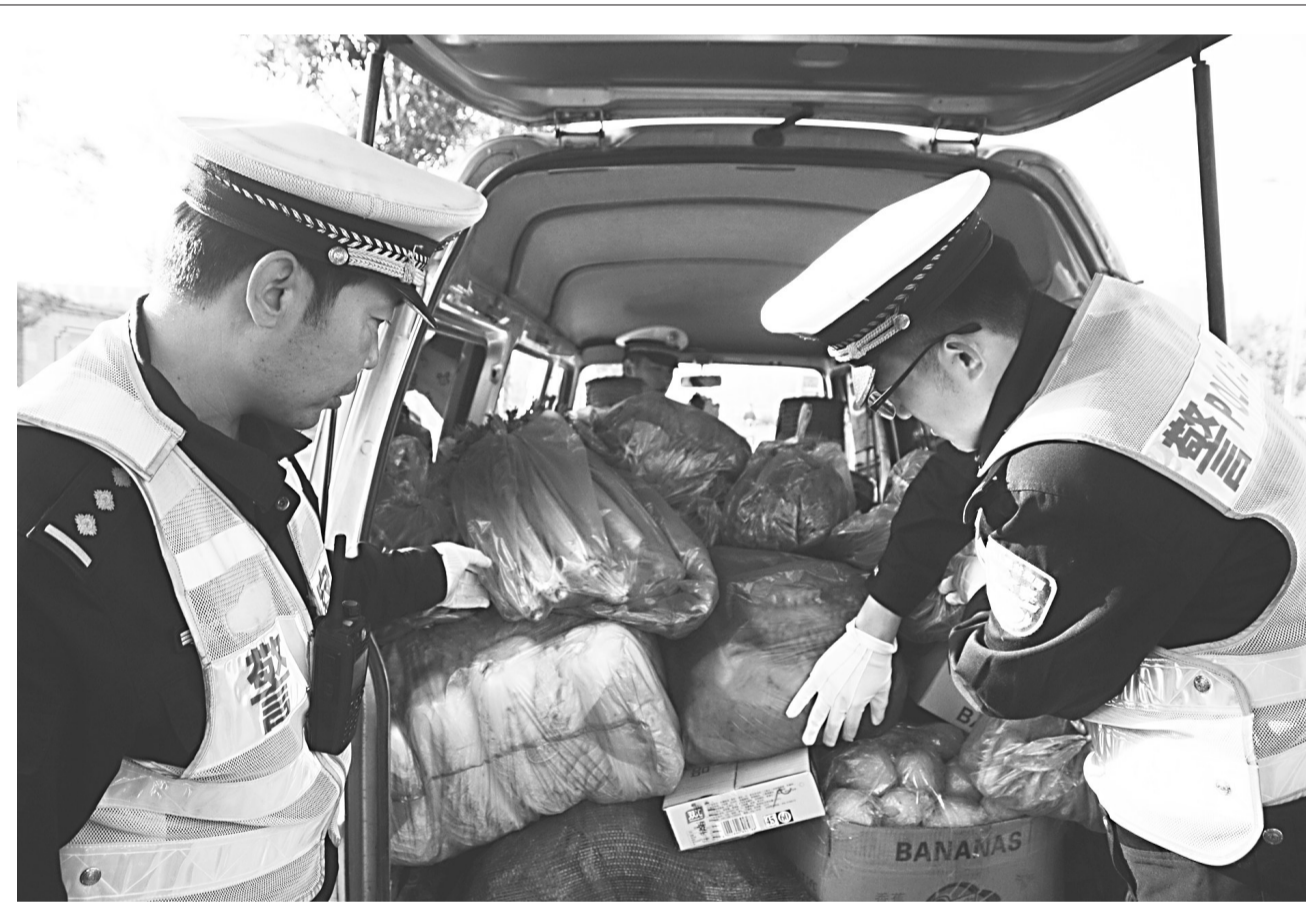
10月14日一大早,一辆客货混装的面包车在沧州市区海丰大道路段行驶时,被正在巡逻执勤的市交警二大队八中队民警当场查扣,经检查,驾驶人将面包车内的座椅全部拆除,拉了满满的一车货物。民警按照相关规定,依法对驾驶人进行了处罚。据了解,近期,该市公安局二大队加大路面交通管控力度,在不同区域和路段对面包车客货混装的交通违法行为进行了统一专项治理,有效地预防和杜绝事故隐患及交通事故的发生。

设置治理点,集中进行整治,加大对外环路和建筑施工区域周边路段的巡逻力度,及时发现和查处违法大型货运车辆。同时,加强视频监控巡查力度,利用设置在路口和路段的视频监控和卡口系统,及时发现不悬挂号牌、故意污损、遮挡号牌,未按规定安装号牌等交通违法行为的车辆,指挥中心及时指挥调度辖区巡逻民警进行查处。治理中,民警根据《中华人民共和国道路交通安全法》,对于故意遮挡机动车号牌、故意污损机动车号牌和未按规定安装机动车号牌的记12分,罚款200元。违法驾驶人将参加7天的交通安全法律、法规和相关知识的培训,并参加道路交通安全法律、法规和相关知识考试(科目一考试),同时,最高准驾车型驾驶资格将被注销。目前,9辆涉嫌违法车辆驾驶人拒绝接受处罚,民警暂扣车辆。