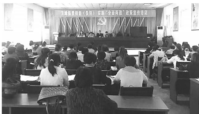
唐山海港经济开发区王滩镇日前开展计划生育政策宣传培训活动,使群众对计划生育政策有了新的理解和认识,也提高了群众对计划生育工作的满意度。

知识等内容,结合案例进行讲授。通过此次培训,有效增强了该公司员工的消防安全意识和责任意识,使员工深刻认识到消防安全工作的重要性,提高了火灾自救能力。 周龙 李建伟