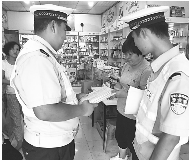
在创建省级文明县城工作中,文安县交警大队开展了道路交通秩序整治行动,重点对乱停乱放、无牌无证、假牌、套牌、酒驾、行人和非机动车闯红灯、不走人行横道、翻越护栏等交通违法行为进行整治。同时,交警向过往车辆司机、沿街商铺业主发放了文明交通倡议书,号召广大交通参与者自觉遵守交通法规。图为民警进入沿街门店发放交通宣传材料。