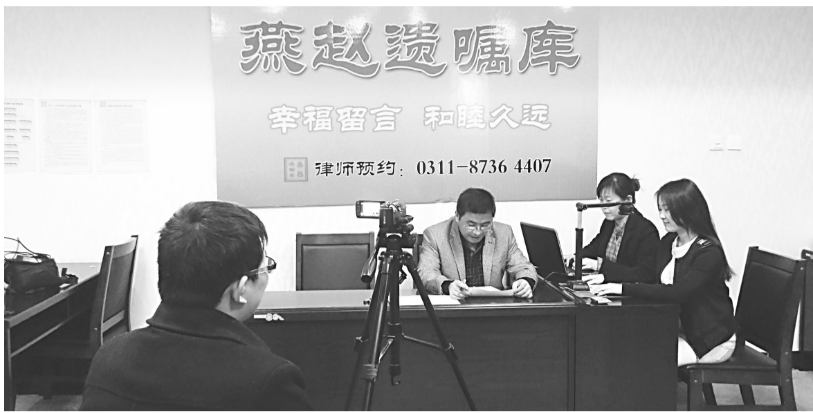
(资料图片)遗嘱登记现场。

为避免自己百年之后爆发“家庭战争”，越来越多的老年人选择生前留下遗嘱。然而，在现实生活中，不少老人自写的遗嘱，或者保管不当丢失，或者到了法院被判无效。那么，应该如何订立一份有效的遗嘱呢？这个问题其实有办法解决。河北首家为60岁以上老人免费提供书写指导、登记保管等遗嘱服务的公益项目——“燕赵遗嘱库”已于去年开始运行，至今已完登记保管遗嘱近千份。 “燕赵遗嘱库”是一个由律师、会计师、银行高管等专业人士承担理论支持和制度设计的遗嘱库，设有严格的保密制度，在这里保管的遗嘱不仅具备法律效力，而且遭遇诉讼时基本可以做到无懈可击。