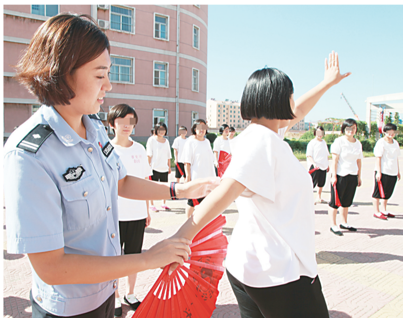
图为民警指导戒毒人员练习太极扇。