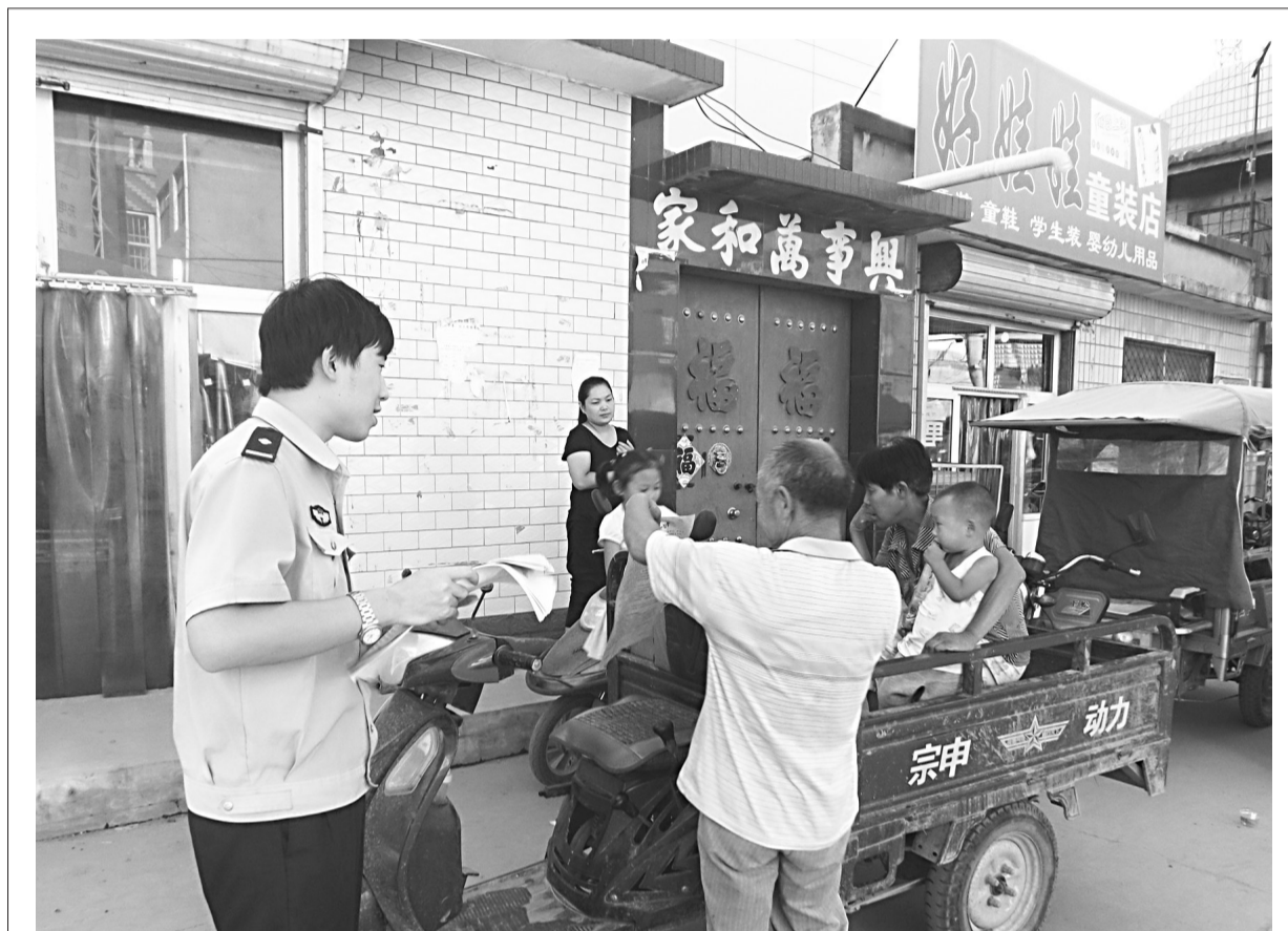
为提升辖区群众消防安全意识,有效预防和遏制火灾事故的发生,新乐市公安局邯鄲派出所民警利用周末时间走进辖区集贸市场开展消防知识宣传。图为民警向过往群众发放宣传资料。

保定分公司要求相关人员认真学习反洗钱法律法规、监管规定和公司管理制度,熟练掌握操作规程,提高反洗钱工作水平;严格履行职责,充分发挥职能,不断强化举措,提升反洗钱工作技能,进一步增强各成员部门在反洗钱工作中的紧密性,为落实工作责任夯实基础。张忠义