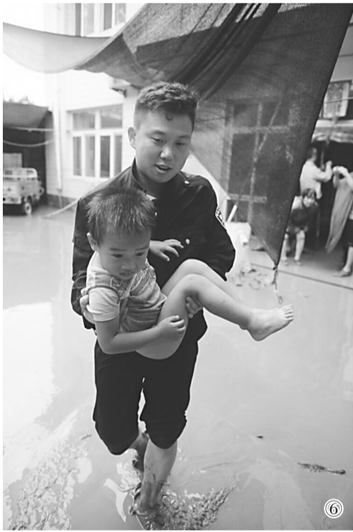
①“别急!我们帮您摆脱困境!” ②雨中的背影,安全的象征! ③“情况紧急,民警用手臂打开排水通道。” ④“乡亲们,我们送大家到安全地带!” ⑤“同志们,加把劲,很快就到目的地了!” ⑥“孩子别怕,叔叔带你去找妈妈!”