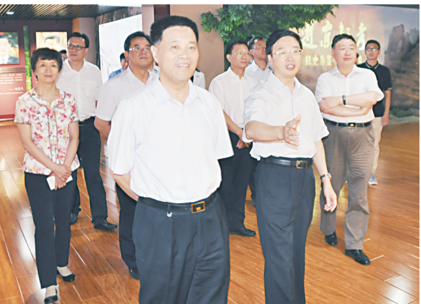
▲图为李如林(前左一)在童建明(前右一)等陪同下到国家检察官学院河北分院视察河北省预防职务犯罪教育基地。