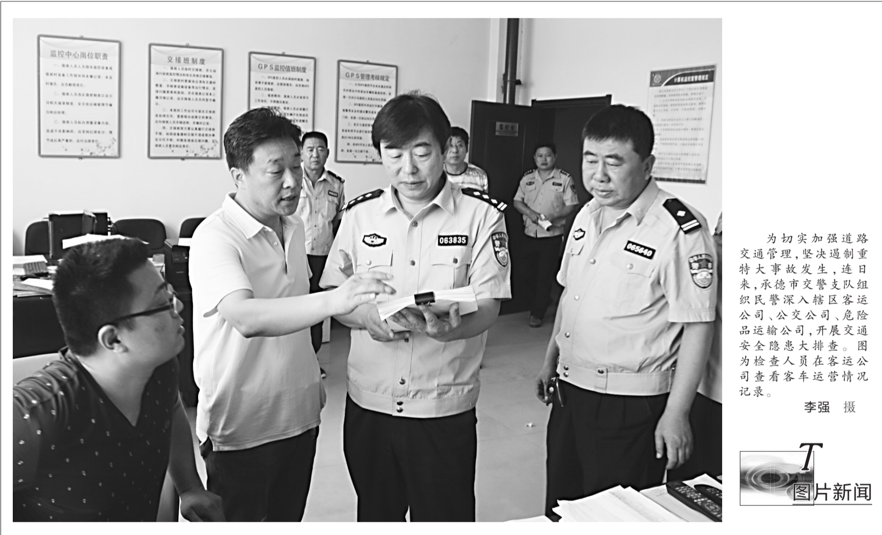
为切实加强道路交通管理,坚决遏制重特大事故发生,连日来,承德市交警支队组织民警深入辖区客运公司、公交公司、危险品运输公司,开展交通安全隐患大排查。图为检查人员在客运公司查看客车运营情况记录。

为深化行动攻坚战,该局日前作出部署,要求集中精力克大家,对省、市挂牌督办的一系列案件、重大案件,要组织精兵强将攻坚克难,尽快侦破;快速反应抓现行,充分发挥110指挥调度、交警和巡警动态巡逻、诸警种协同作战、社会治安力量密切配合的优势,提高快速反应能力,加大围追堵截力度,力争把更多犯罪嫌疑人在案发地段;强化审查控积案,已抓获的盗抢犯罪嫌疑人,要加强审查深挖工作,力争破一案、带一串,查一人、带一伙,扩大战果。