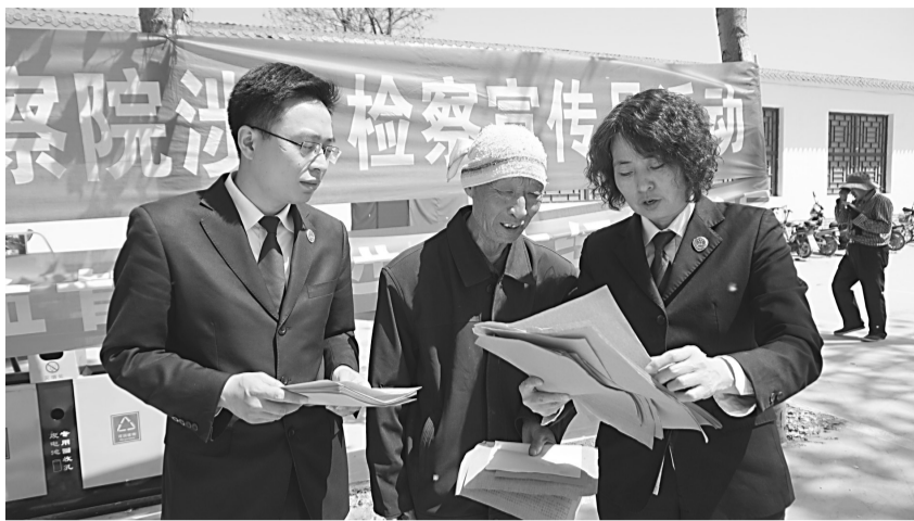
资料图片：侦监干警在农村集市宣传涉农法律知识。

建立信息共享机制强化社会治安动态监督。该院侦监部门与公安机关和该院自侦部门建立了案件信息共享机制，根据收集到的案件情况，对侦查机关的立、破案情况及违法人员处理情况进行动态跟踪监督，及时发现立案监督线索，主动加强宣传拓宽立案监督渠道。同时，定期组织侦监、公诉、控申等部门干警，深入社区、乡镇开展法律法规宣传活动，向群众广泛宣传宣讲刑事立案监督工作的具体内容、职能范