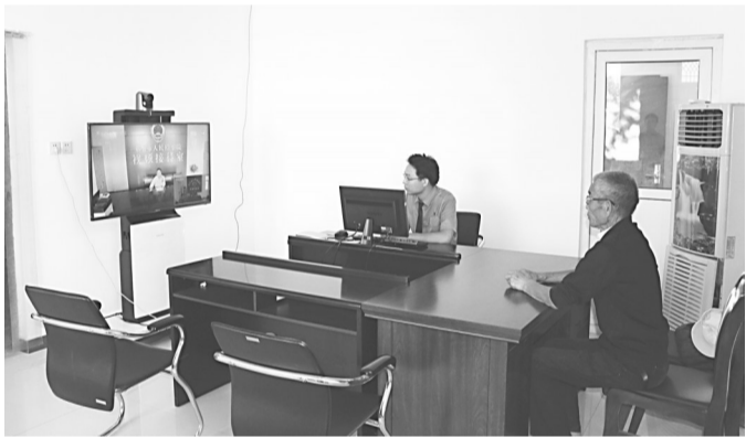
图为柏乡县检察院开通远程视频接访，与市院接待中心实现对接。

本报讯（郝占川）控告申诉部门将群众来信来访工作，作为维护社会稳定和公平正义的重要内容来抓，通过多种举措切实提高来访群众的满意度。