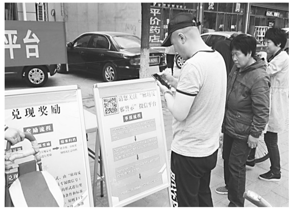
现场群众扫码关注反邪教微信、微博。

近日,大厂回族自治县在县城东大集组织开展了推广反邪教微信、微博宣传活动。带有反邪教微信、微博二维码的宣传展板,扫码送礼品的方式吸引了过往群众的关注。此次宣传活动将持续开展到广场、集市、公园等人员相对集中的场所及乡镇(街道)。(向东)