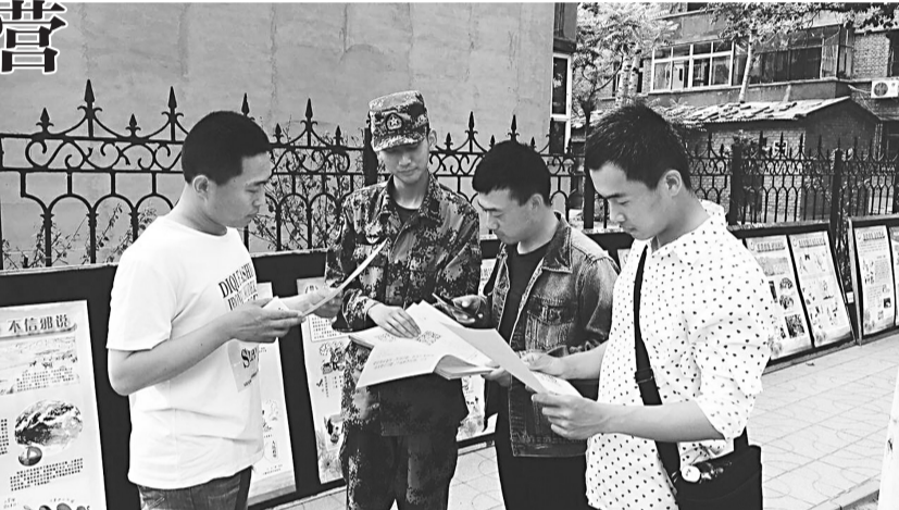
部队反邪教志愿者向过往青年发放反邪教微信平台开通宣传手册。

区和营区门口向参观的广大官兵和过往群众集中宣传,发放了2000余份反邪教宣传手册和廊坊市开通反邪教微信平台开展有奖举报活动的宣传资料。此次反邪教警示教育由军地双方联手开展。通过系列宣传活动,广大青年官兵和家属进一步认清了邪教反党反社会主义的反动本质,识别了邪教进行渗透破坏的卑劣伎俩,极大地提高了部队官兵同邪教组织做斗争的坚定性和自觉性,筑就了部队官兵意识形态上的反邪教“防火墙”。