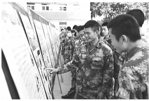
反邪教图片展览。部队官兵正在观看