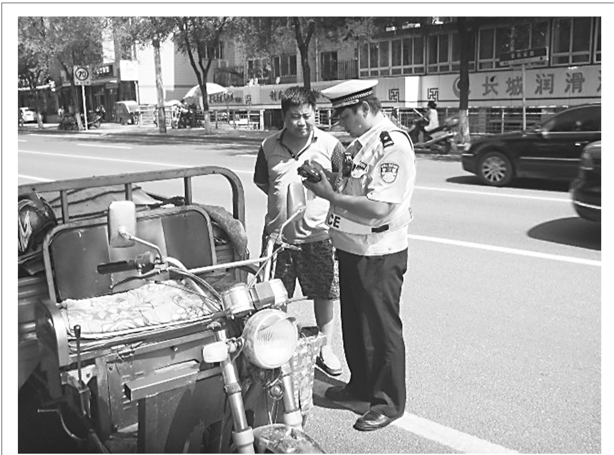
为保障旅游旺季良好的道路交通环境,承德交警支队针对不同的交通违法行为,经常性地开展整治行动。图为6月12日,承德交警直属二大队民警对一起三轮车的违法行为进行查处。

该局建立考核量化机制,切实做好对环境监察执法人员的考核量化管理;健全竞争激励机制,最大限度地调动环境监察执法人员的工作积极性;建立执法监督机制,不断提高环境监察的执法质量和执法效率;完善责任追究机制,形成良好的责任导向。郑斐