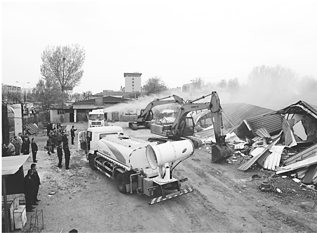
秦皇岛市打击“双违”(违法用地、违法建设)专项行动开展以来,各县、区在深入动员部署的基础上,及时组建集中整治机构,建立健全“网格化”管控机制,对所辖区域进行摸底调查,逐一分类、建立台账。行政村、乡(管理处、办事处)和机关职能部门建立联防联控机制,以此巩固集中整治成效。截至目前,秦皇岛市共累计整治“双违”440处,面积约34.98万平方米。