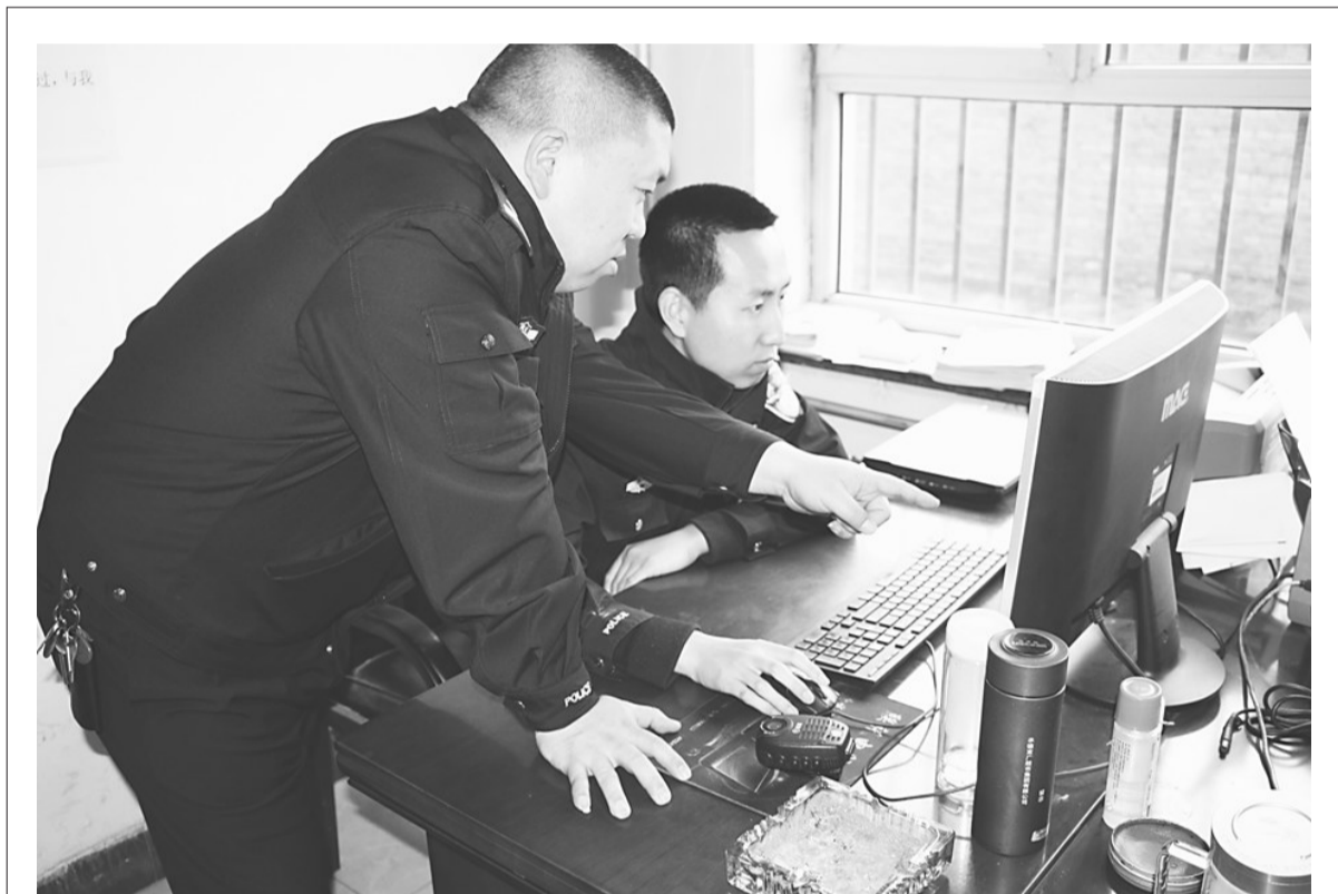
为保障道路交通事故受害人的合法权益,隆化交警大队事故科民警在依法处理交通事故的同时,加大对肇事逃逸人员的追逃力度。图为4月6日,民警在网上对一起交通事故肇事逃逸人的信息进行比对。

据悉,2015年以来,该院共对4名符合条件的未成年犯罪嫌疑人作出附条件不起诉决定,无一起案件申诉。