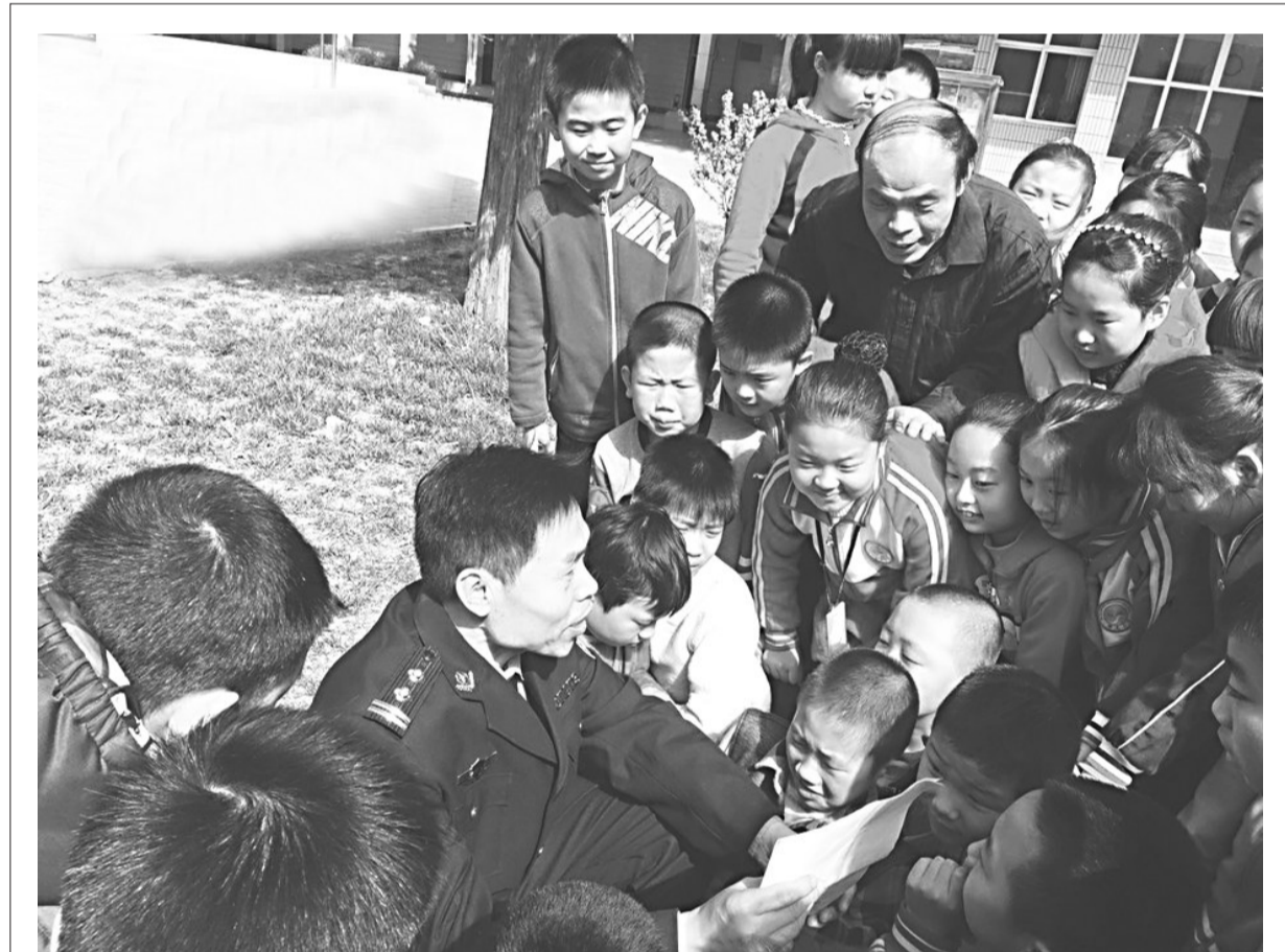
“上学路上不打闹,靠右行走要记牢。先下后上公交车,路边礼物咱不要。”4月5日上午,石家庄市曙光小学四(一)班的孩子们争先恐后地回答着民警叔叔的提问。“请警察叔叔上一堂安全教育课”,是该校今年安全教育日活动的延续。孩子们在与民警交流互动的过程中将安全牢记心中。

邯郸市经济开发区交警大队采取四项措施,全力预防道路交通事故,为群众出行创造优质道路交通环境。 该大队强化动员部署,进一步提高民警思想认识,确保各项措施落到实处;强化路面管控,严查违法行为;强化整治力度,形成严管态势;强化交通安全宣传教育,提高群众交通安全意识。 李玲 张盼盼