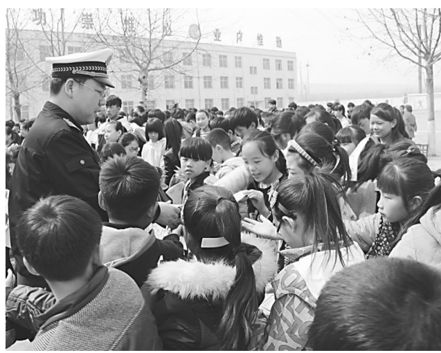
沙河市交警大队民警日前走进辖区基村镇泰华中学,为该校500余名师生上了一堂交通安全课,受到了学校领导和广大师生的热情欢迎,有效提高了师生安全出行意识。图为民警正在向学生分发交通安全宣传资料。

配巡防力量,科学安排巡防勤务。他们严格落实“动中备勤”的警务模式,实行就近处警、快速反应、迅速打击,同时在主城区开展24小时巡防守护,最大限度地警力摆上街面,对“两抢一盗”等违法犯罪进行重点打击。 据数据显示,今年1至3月份全县“两抢一盗”案件与2015年同期相比下降86.69%。其中,刑事立案与2015年同期相比下降84.15%;行政立案与2015年同期相比下降88.43%。