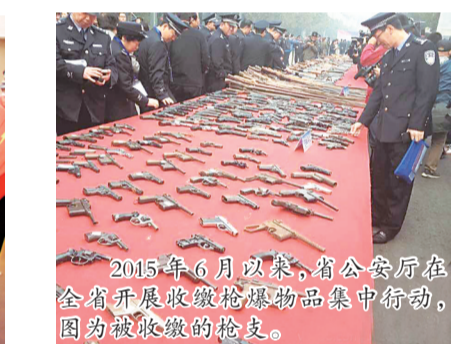
2015年6月以来,省公安厅在全省开展收缴枪爆物品集中行动,图为被收缴的枪支。