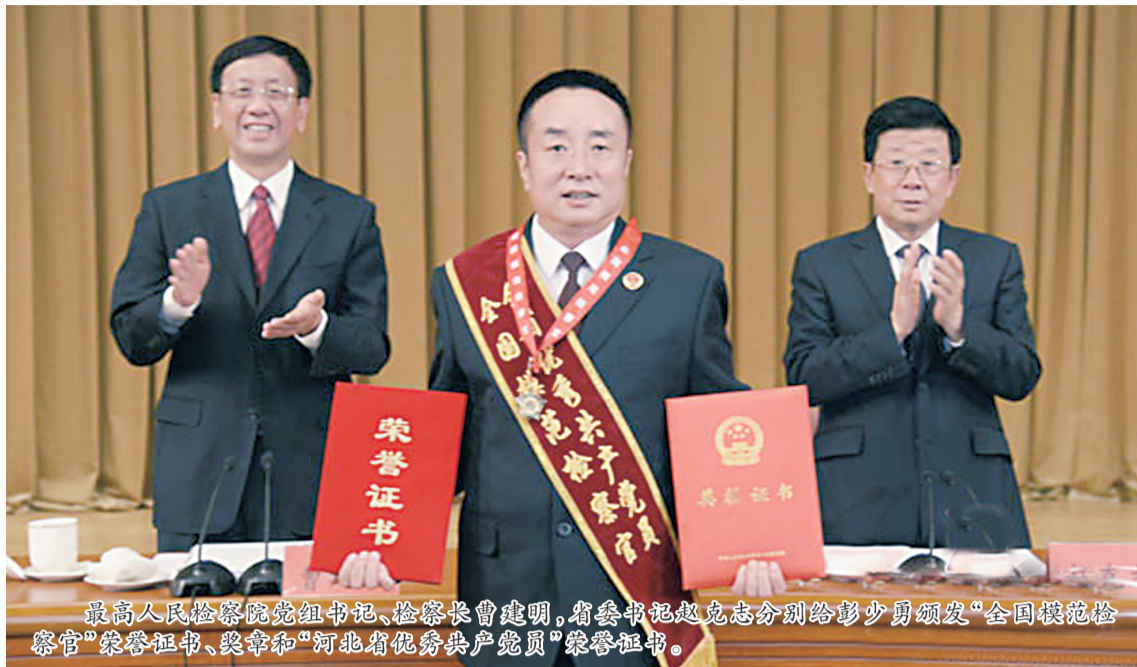
最高人民法院党组书记、检察长曹建明,省委书记赵克志分别给彭少勇颁发“全国模范检察官”荣誉证书、奖章和“河北省优秀共产党员”荣誉证书。