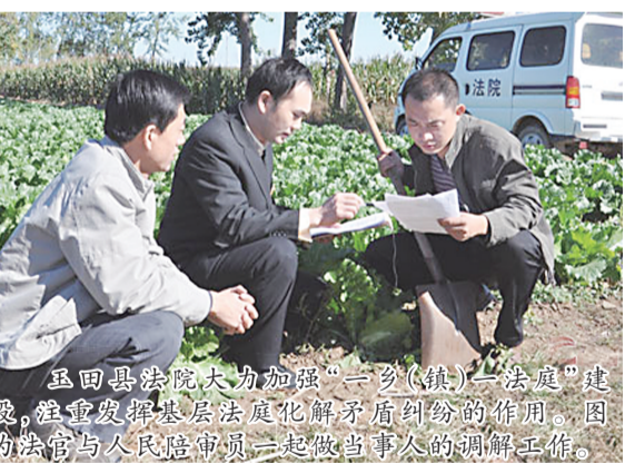
涞源县法院大力加强“一乡(镇)一法庭”建设,注重发挥基层法庭化解矛盾纠纷的作用。图为法官与人民陪审员一起做当事人的调解工作。