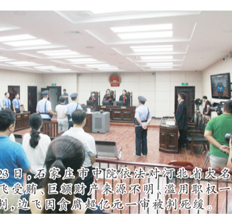
2015年6月28日,石家庄市中院依法对河北省定县原县委书记边飞受贿、巨额财产来源不明、滥用职权一案进行了一审宣判。边飞因贪腐超亿元一审判判死刑。