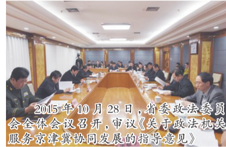
2015年10月28日,省委政法委员会全体会议召开,审议《关于政法机关服务京津冀协同发展的指导意见》。