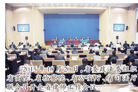
2015年10月20日,省委政法委员会组织省高院、省检察院、省公安厅、省司法厅联合召开全省律师工作会议。