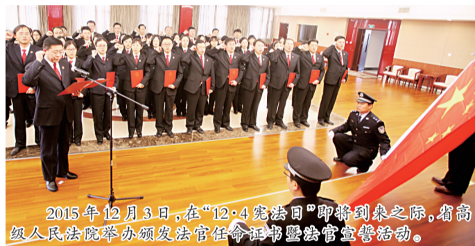
2015年12月3日,在“12·4宪法日”即将到来之际,省高级人民法院举办颁发法官任命证书暨法官宣誓活动。