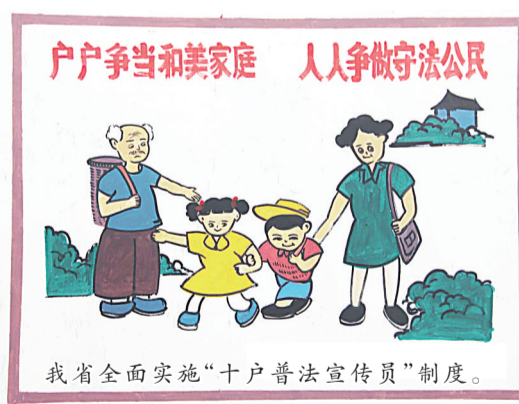
户户争当和美家庭 人人争做守法公民 我省全面实施“十户普法宣传员”制度。

帮互学、一人带动、共同学法”为原则,在农村和社区中以十户左右为一个基本单位,将相邻或相近的居民组成学法守法用法小组,并在每一小组中选任一名法治宣传员,通过宣传员的组织发动、示范带动、交流互动,广泛开展法治宣传教育活动。“十户普法宣传员”集法治宣传员、人民调解员、法律服务员、治安联防员于一身,把国家法律法规和政策宣传到人民群众身边,把矛盾纠纷化解在萌芽之中,把治安联防做到家,把法律服务做到人。