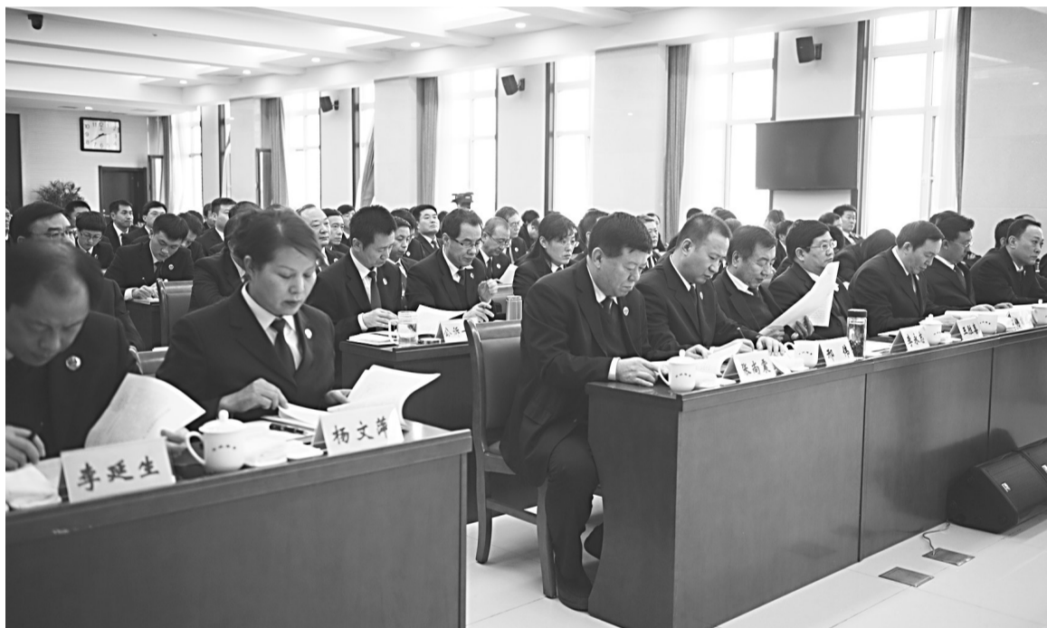
2月2日,在全省检察长会议上,各设区市检察院和省直管的定州、辛集市检察院检察长及各内设机构副处级以上领导干部等与会人员在认真听取省检察院党组书记、检察长童建明作主旨讲话。

石家庄市检察院检察长陈晓明、廊坊市检察院检察长冀运福、保定市检察院检察长傅君佳、邢台市检察院代检察长邢伟、省检察院公诉一处处长高恩泽、省检察院监所处处长王志刚分别在大会上作了发言。