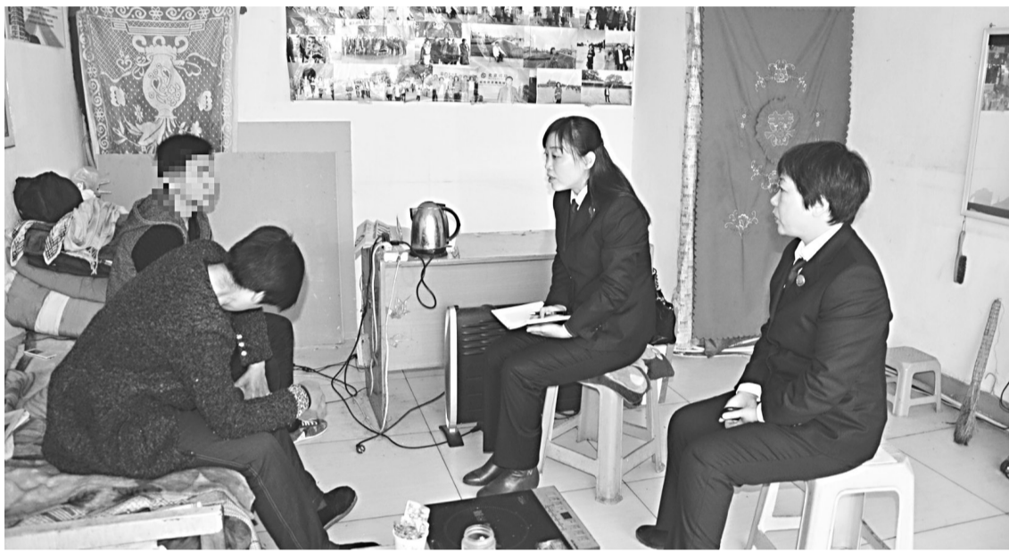
黄骅市检察院一直以来认真贯彻未成年人刑事案件诉讼程序的相关规定,在办理好此类案件的同时,一方面对犯罪嫌疑人注重案后帮教,送法进家;一方面对受害人开展心理疏导,温暖人心,取得了良好的法律效果和社会效果。图为该院未检干警送法进家,正在对犯罪嫌疑人进行案后帮教。

今年4月,蠡县检察院反渎局接到举报,称县城规划局违规为建设单位办理建设工程规划许可证。接到这一举报后,反渎干警反复分析,坚定了查办案件的信