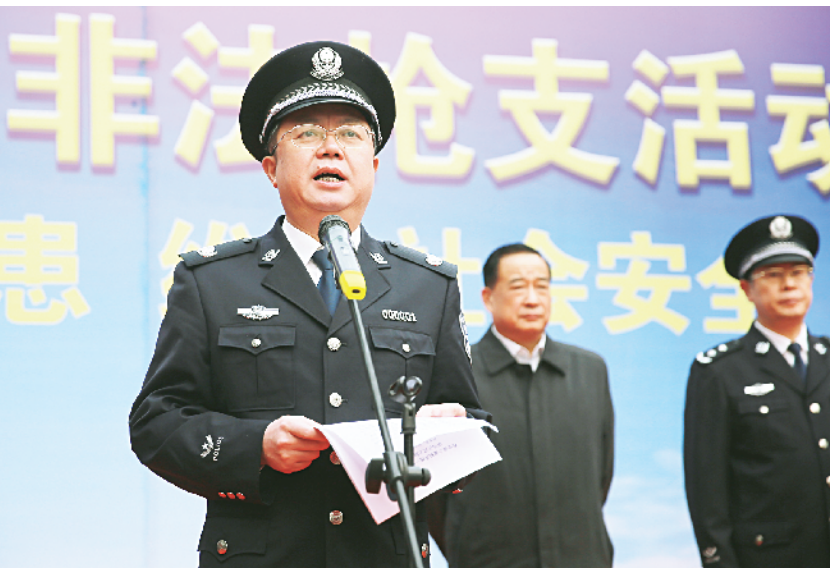
董仝生发布销毁非法枪支命令。

本报 11 月 5 日讯 (记者宋法绪 韩志强)今天上午 9 时 33 分,随着副省长、公安厅厅长董仝生一声令下,全省公安机关统一销毁非法枪支活动在邯郸市邯钢集团正式开始,19420 支公安机关收缴的非法枪支被送入销毁炉。