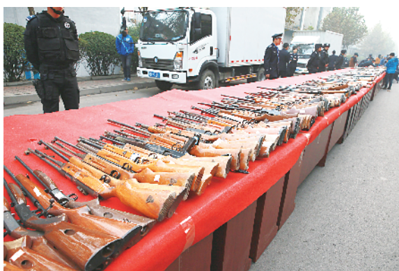
警方收缴的部分非法枪支。

据介绍,在所有收缴的非法枪支中,群众主动上缴的枪支占一半左右,群众还积极向公安机关提供涉枪涉爆线索。到目前,全省公安机关向查证属实的举报群众发放奖金 305 万元。