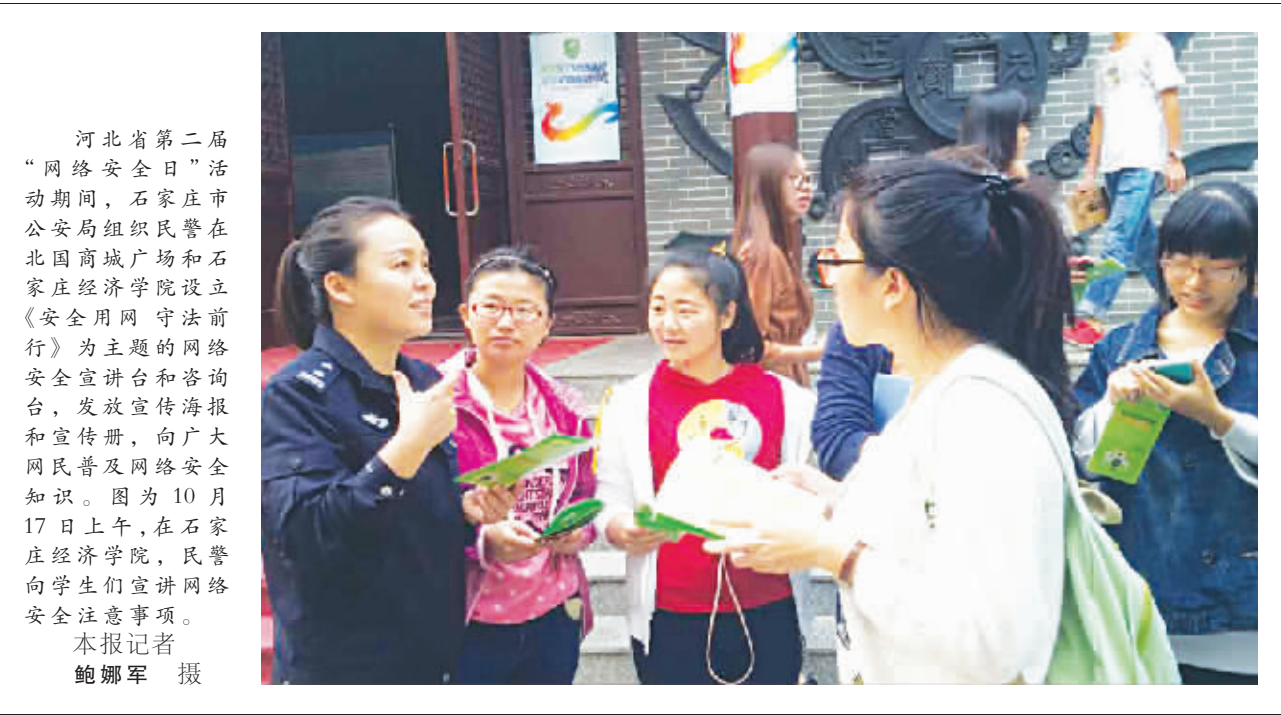
河北省第二届“网络安全日”活动期间,石家庄市公安局组织民警在北国商城广场和石家庄经济学院设立《安全上网 守法前行》为主题的网络安全宣讲台和咨询台,发放宣传海报和宣传册,向广大网民普及网络安全知识。图为10月17日上午,在石家庄经济学院,民警向学生们宣讲网络安全注意事项。

强化执行期限制度。严格遵守《最高人民法院关于人民法院办理执行案件若干期限的规定》,将有关期限的规定全面纳入考核考评管理工作中,进行严格的考核考评。