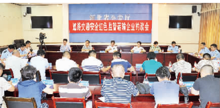
省公安厅、交通运输厅、安监局正在对12家交通违法“大户”企业负责人进行约谈。

本报8月5日讯(记者 刘波)今天,省公安厅、省交通运输厅、省安监局召开2015上半年红色重点监管企业约谈会,集中约谈12