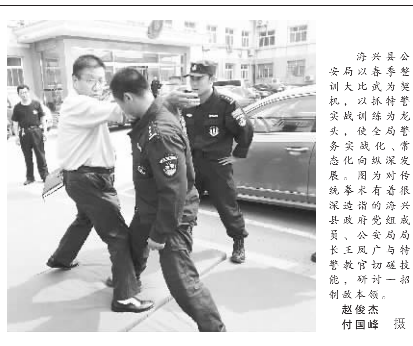
海兴县公安局以春季比武为契机,以抓特警实战训练为龙头,使全局警务实战化、常态化向纵深发展。图为对传统拳术有着很深造诣的海兴县政府党组成员、公安局局长王凤广与特警教官切磋技能,研讨一招制敌本领。

业企业排污治理四项行动。行动期间,该局开展专项检查23次,检查企业198家,破获污染环境案1起,刑事拘留1人,办理行政案件8起,行政拘留9人,制止秸秆焚烧行为16起,责令停产企业2家,限期整改企业53家。 据了解,该局目前开展了打击环境污染犯罪“蓝天清水”专项行动,持续开展打击非法处置医疗废物、废旧矿物质油等专项行动,推进环境污染重点区域集中整治行动,严厉打击恶意破坏大气污染源自动监控设施、擅自篡改监测数据的违法犯罪行为。