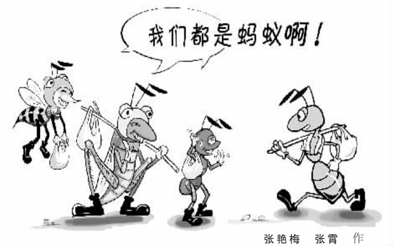
张艳梅 张霄 作