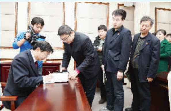
图为签名送书仪式现场。