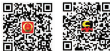
最高人民检察院官方微信 正义网官方微信