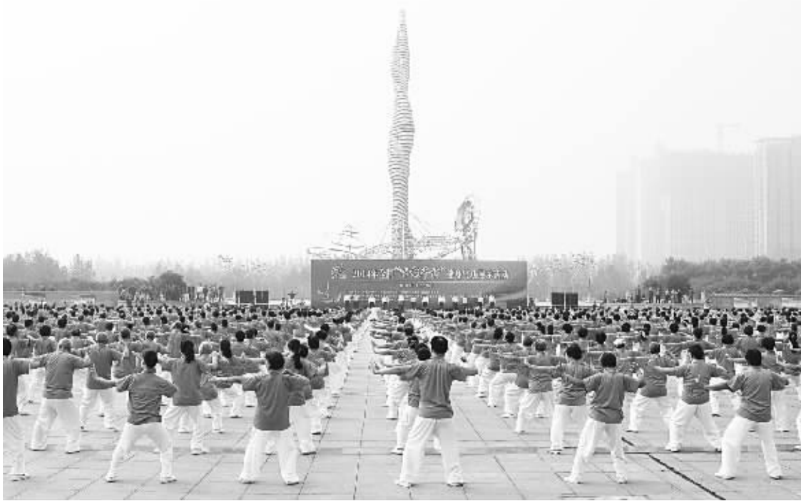
图为石家庄火炬广场群众练习“八段锦”展示现场。

“两手托天理三焦、左右开弓似射雕、调理脾胃须单举、五劳七伤往后瞧……”伴随着悠扬的音乐,来自石家庄市100余个站点3000余名健身气功爱好者开始舞动“八段锦”。上月底,石家庄市火炬广场举办了一场颇为壮观的健身气功展示活动。