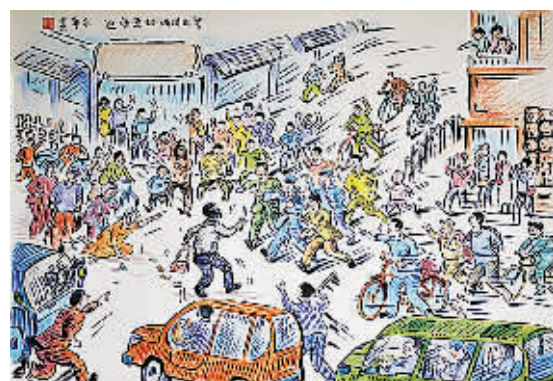
民警团结劫匪难逃(漫画)

你融入茫茫夜色 你穿过灯火阑珊 不管是狂风暴雨 还是那雷鸣电闪 不管是泥泞小路 还是那山道弯弯 总为赶赴现场赢得时间 手中的画笔力压千钧 肩上的责任重于泰山 胸中装有一杆秤 常把百姓记心间