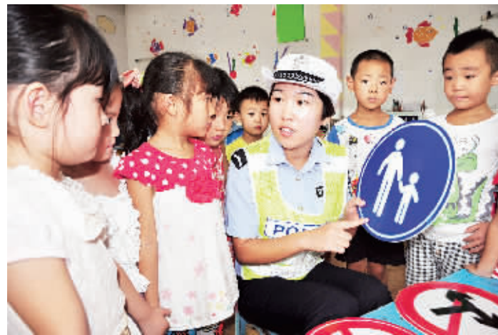
开学临近,保定市交警六大队组织民警深入辖区社区、农村,针对中小学生学习交通安全宣传活动,使学生们在思想上时刻系牢“安全带”,受到学生家长好评。

为减少“一票否决”,减轻基层负担,省委组织部深入挖掘问题根源,从机制创新和清理规范入手,制定出台了创新和完善干部目标考核的“一个意见、三个办法”,形成了干部考核新机制。实行干部年度考核、绩效考核、党风廉政建设考核“三考合一”的综合考核评价机制,同时把分散在部门的专项考核项目统一纳入到干部综合考核评价中。省委干部考核明确规定要取消名目繁多、导向不正确、影响干部积极性的过多过滥考核和“一票否决”项目,规定各部门专项考核实施方案(细则),须经省委干部考核领导小组审核后备案后实施,考核结果纳入综合考核评价中运用。把一些程序复杂、指标繁琐的考核压缩精简,力求达到科学规范、有效管用。