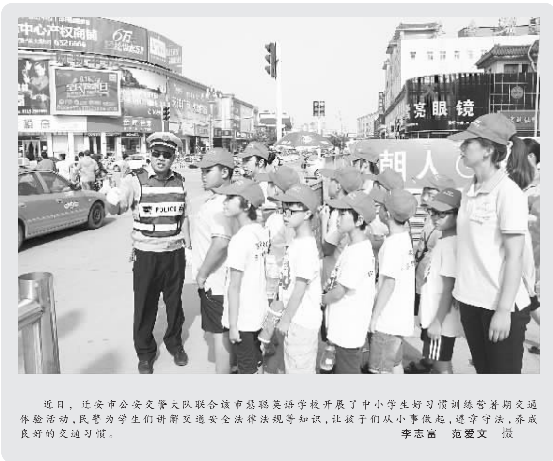
近日,迁安市公安交警大队联合该市慧聪英语学校开展了中小学生学习好习惯训练暑期交通安全体验活动,民警为学生们讲解交通安全法律法规等知识,让孩子们从小事做起,遵章守法,养成良好的交通习惯。

现在尽管中铁十四局已道歉,但有关部门有必要彻底查清事故来龙去脉,并将所有信息公之于众,这既是对公众知情权的尊重,也是为今后的安全管理提供镜鉴。