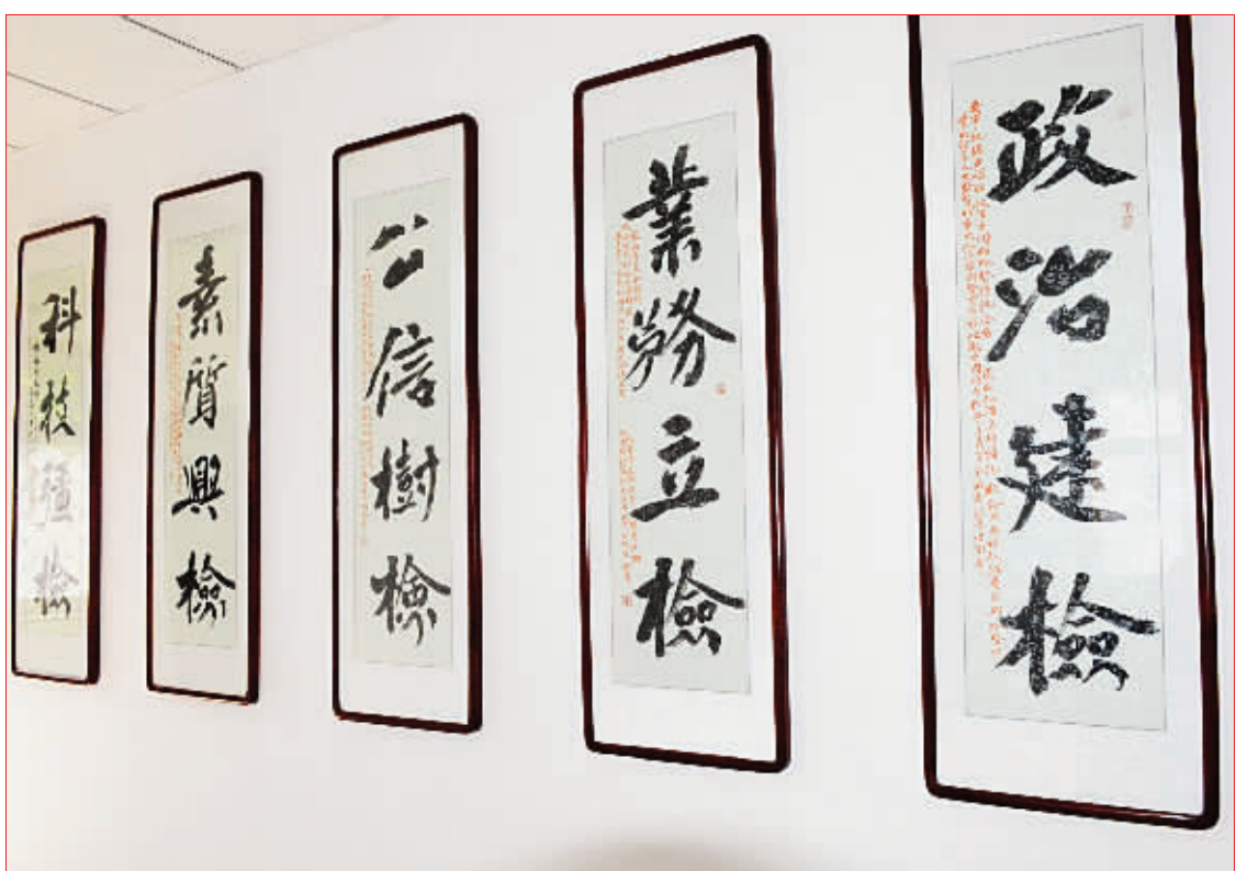
“政治建检、业务立检、公信树检、素质兴检、科技强检”,今年年初全省检察长会议提出的这一总体布局,在我省各级检察机关得到认真贯彻落实。本片摄于石家庄铁路运输检察院。本片书法作者:河北省人民检察院 刘谨