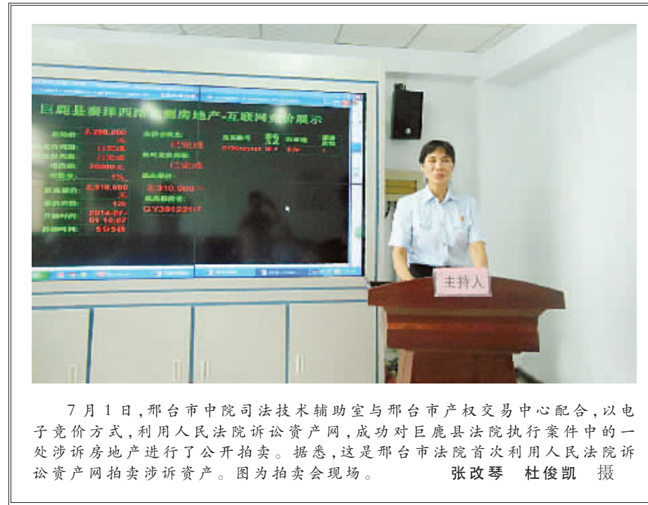
7月1日,邢台市中院司法技术辅助室与邢台市产权交易中心配合,以电子竞价方式,利用人民法院诉讼资产网,成功对巨鹿县人民法院执行案件中的一处涉诉房地产进行了公开拍卖。据悉,这是邢台市中级人民法院首次利用人民法院诉讼资产网拍卖涉诉资产。图为拍卖会现场。

面。法官暗示孙晓光,要带着儿子到庭。孩子是父母的命,拿“命”说事,是解开疙瘩的“钥匙”。