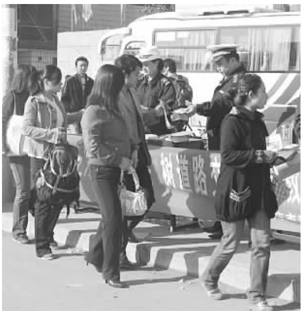
为给广大群众提供畅通有序的交通环境,日前,高碑店市交警大队在汽车站前设立宣传台,摆放宣传展板,加强出行引导和安全提示工作。图为民警向群众发放宣传材料。

民警提醒:网上交易过程中,不要随意点击他人提供的不明链接和图片,一旦发现受骗,要立即报警,同时更新电脑杀毒软件或病毒库,更改支付宝等关乎资金安全的密码。