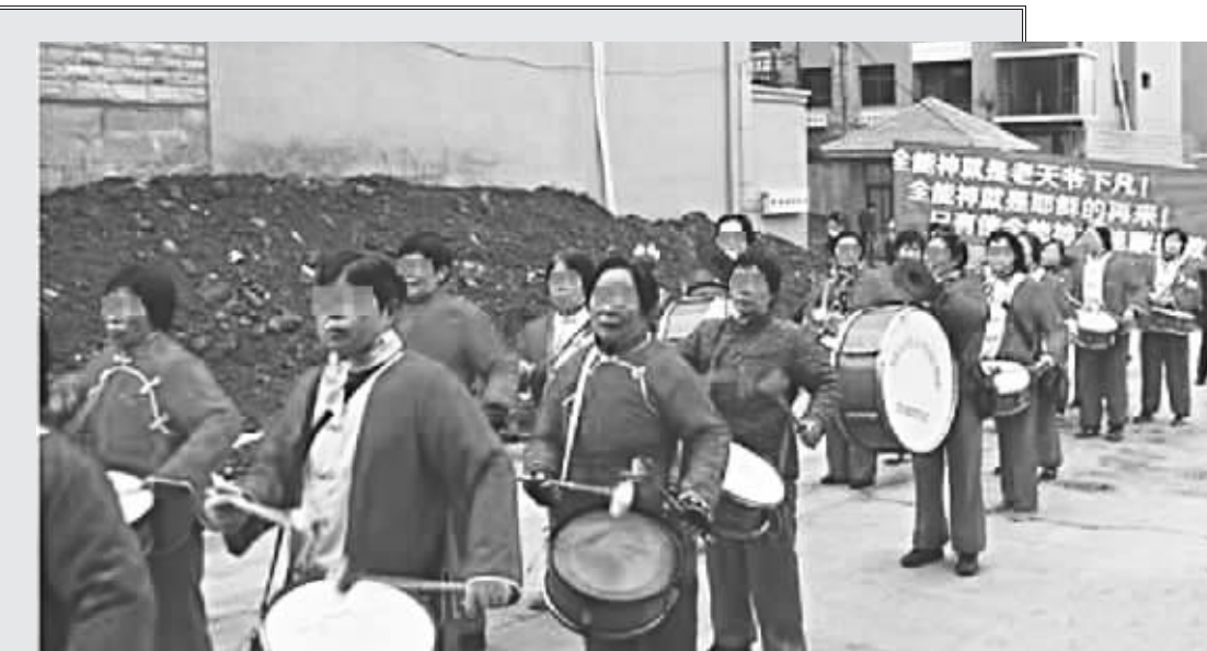
锣鼓本是用来欢庆的,可这些敲锣打鼓为“全能神”“叫卖”的中老年妇女脸上,却看不到丝毫的喜悦。大量的事例证明,“全能神”带来的不是幸福和快乐,而是灾祸与痛苦!

至此,不管你目不识丁,还是学富五车,只要没有科学的“世界观、人生观、价值观”,都可能在这些逻辑陷阱中迷失方向。于是,一批批“木偶”制造完毕。他(她)们深信:工作没意思,挣钱没意思,家庭没意思,夫妻感情没意思,子女没意思……只有天天聚会、听人讲道最有意思。谁要是劝他(她)们清醒一下,反而会被看成魔鬼和撒旦。