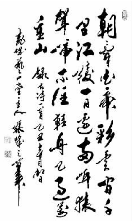
张峰 作 (作者单位:深州市公安局)