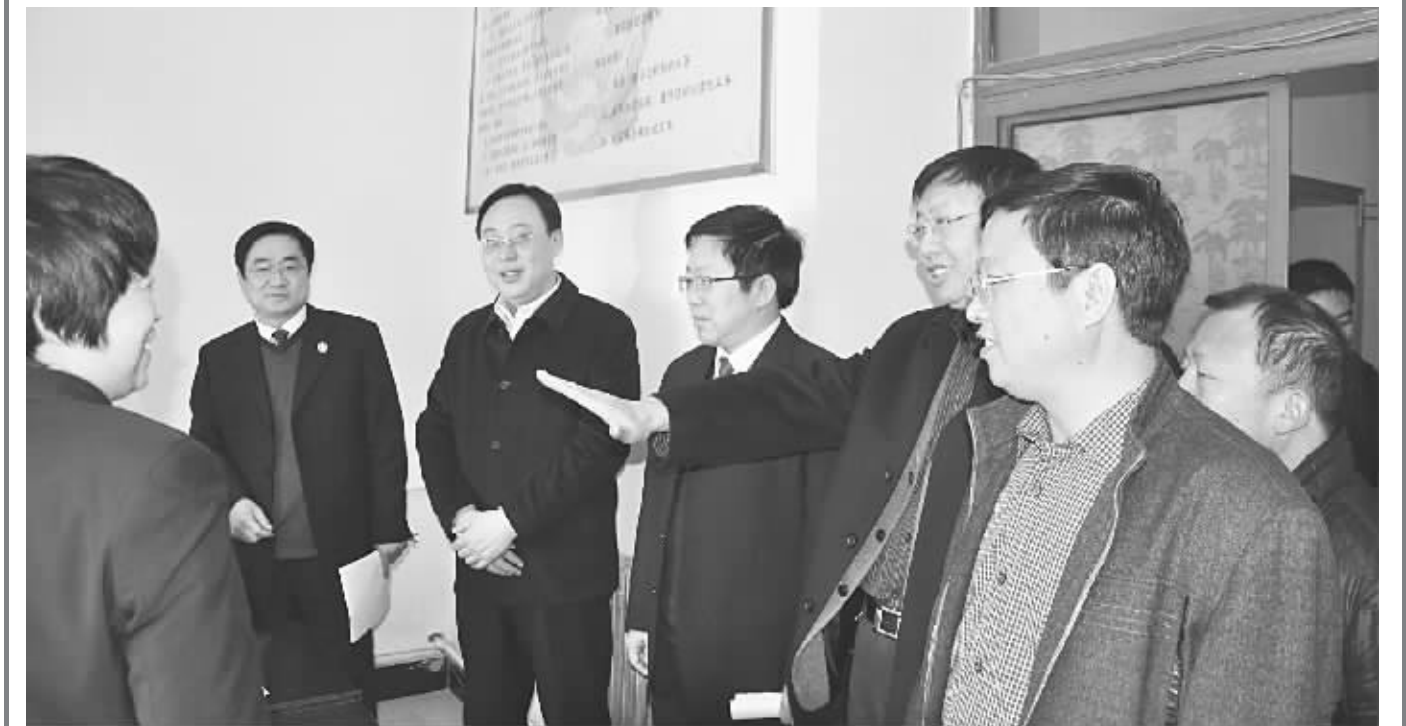
为增强法院工作透明度,拓宽司法公开渠道,将法院工作自觉置于社会各界的监督之下,使全社会更加理解和支持法院工作,近日,衡水市各级法院举行“法院开放日”活动。图为枣强县法院“法院开放日”活动现场。

发挥特殊人群管控助力平安衡水建设的作用。认真开展核查纠正社区矫正人员脱管、漏管专项活动,加强对社区矫正人员的管控。截至10月底,全市累计接收社区矫正人员3437名,累计解除1932名,社区矫正对象表现良好。组织刑释解教人员调查摸底活动,分类登记造册,落实帮教力量和帮教措施。加强安置帮教基地建设。全市共建立安置帮教基地25个,为刑释解教人员重新融入社会搭建了平台。