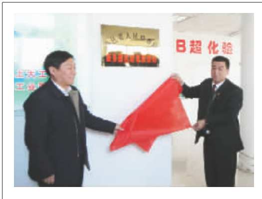
11月27日上午,“高邑县人民检察院服务园区建设联络站”在该县经济开发区管委会揭牌。这是高邑检察院在全市检察系统开展的“服务园区建设、走访百家企业”活动中,打造的一个服务园区企业的崭新平台。

力地推动和促进了刑事审判工作的规范化和制度化。 量刑规范化全面推进。2012年,全省基层法院共审结量刑规范化试点罪名案件22162件,上诉率为3.80%,抗诉率为0.51%,与未施行前均有大幅下降,较好地实现了刑罚的惩罚、教育和预防功能。 刑事审判队伍素质明显提升。几年来,全省各级法院深入开展“人民法院为人民、人民法官为人民”主题教育实践活动及“群众观点大讨论”、“创先争优”等活动,刑事审判队伍的政治素质、业务能力、司法作风都有了新的提升。