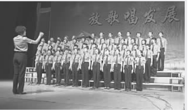
三河市检察院干警参加了市委组织的歌咏比赛。图为歌咏比赛现场。

本报讯(通讯员 孙建军 邵帅)三河市检察院积极推动“无纸化办公”,通过制定《加快信息化建设实施方案》,与软件开发公司主动联系,提出对现有办公办案软件修改要求,加快推进机关信息化建设步伐,适应新形势、新情况。全院干警将充分利用办公办案软件、内网网站、内网QQ等信息手段,节约办公资源,形成更加高效、节能的良好工作方式和环保办公新理念。办公办案、信息交流、文稿审批等工作,全部在网上进行;加强文件报送审核,控制文件印发数量,除留档文件外,一律不再印纸质文件;加强对网上信息处理和反馈,明确每科室一名责任人,负责对必须要保存的文件进行下载、处理、反馈、追踪等,确保不遗漏事项,有效地提高了办公、办案效率同时做到环保节能。