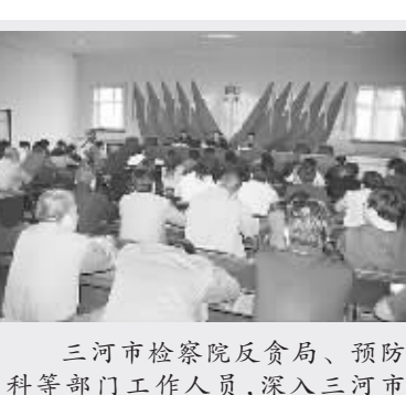
三河市检察院反贪局、预防科等部门工作人员,深入三河市皇庄镇,为该镇机关干部和49个村街“两委”班子主要负责人共140余人做涉农职务犯罪预防专题报告。