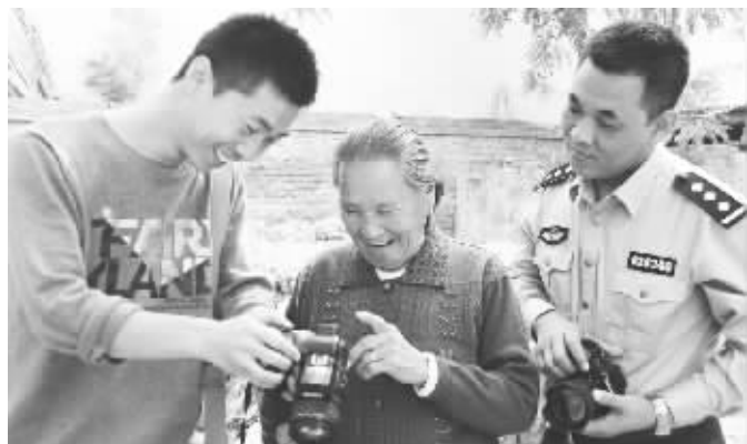
重阳节前夕,广平县公安局联合该县摄影家协会,为百名老人免费拍照。他们用手中的相机,记录下老人们幸福快乐的生活和微笑,并制作成片,送给老人们。图为广平县上坡村老人看到为自己拍摄的照片后,高兴得合不拢嘴。

经审查,当日7时许,安药集团开发商在此处进行房屋拆迁时受到当地居民阻挠,门某等43名违法嫌疑人便到该居民点实施暴力施工,个别嫌疑人身上还携带管制刀具,当地5名居民均有不同程度的受伤。当日下午,东金庄派出所依法对门某等12人处以行政拘留和罚款的处罚。