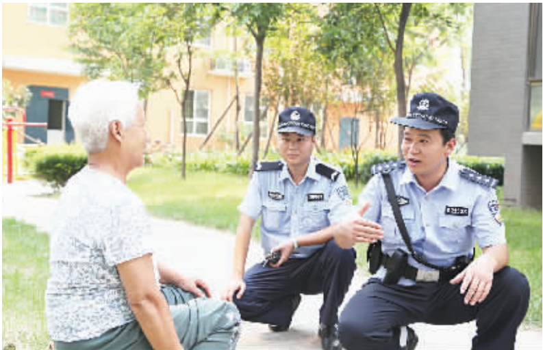
按照邯郸市公安局长台分局进一步深化和完善主城区巡防体系建设的统一部署,丛台分局在现有“网格化”勤务模式的基础上,推动巡防工作向社区和居民小区延伸、向单位内部延伸、向网上视频监控延伸,实现全域覆盖。图为民警正在社区内走访。

那么,何景云又该如何解除心中的疑虑呢?河北升阳律师事务所孙桂林律师认为,案件虽然早已调解完毕,但只要一方当事人提出异议,公安机关就应视为可疑案件,及时进行复查,而伤情能否重新鉴定,应视情况而定。