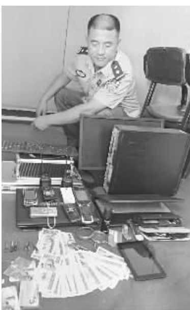
民警在清查缴获的部分赃物。

民警在去往盗窃现场的路上看到南屯村北公路边翻着一辆蓝色奇瑞QQ汽车,车边的树被撞得拦腰折断,车头被撞烂,车内外有血迹,方向盘被顶弯,没有发现驾驶人,且当天该路段没有事故报