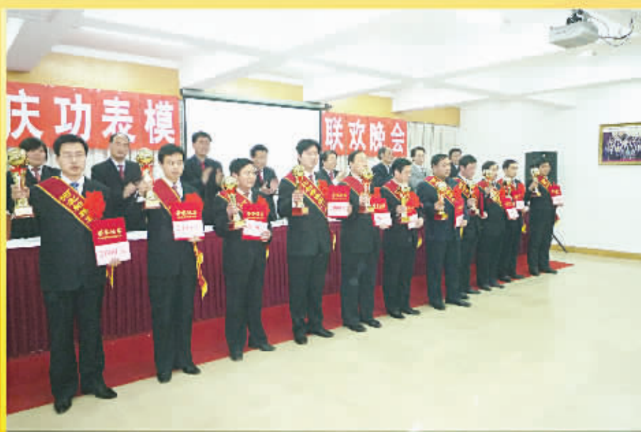
为优秀员工颁奖现场