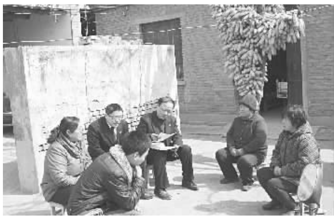
▲资讯图片:落实法官联系村庄制度,法官到当事人家中调解矛盾纠纷。