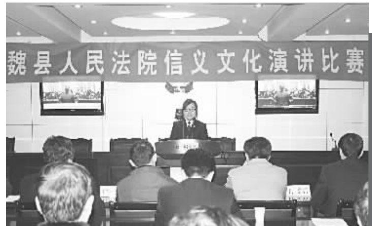
▲资讯图片:魏县人民法院举行信义文化演讲比赛,开展以“重信尚义、司法为民”为主题的信义文化建设。