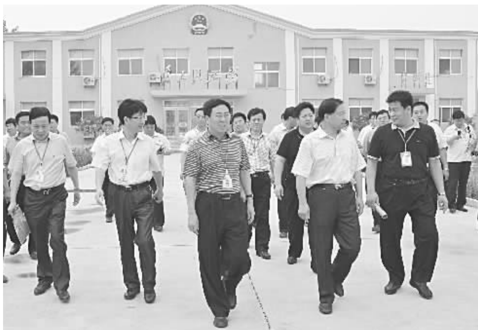
邯郸法院系统“两庭”建设现场会期间,市中级人民法院党组书记、院长赵增国(前右三)到双井中心法庭观摩“两庭”建设工作。

一是院党组结合县情及民风朴实的特点,出台了《魏县人民法院“信义”文化建设的实施方案》。从建设“信义”文化的目的、意义及如何进行“信义”文化建设和如何将“信义”文化建设融入审判工作中均做了详细的规定,要求干警在点滴工作中身体力行、率先垂范。使干警在潜移默化中,教育、熏陶、引导、规范干警言行,点点滴滴工作中重信义、讲诚信,取信于民。通过干警的“重信尚义”教育,辐射身边的人民群众,在社会上传递“重信尚义、司法为民”的正能量,树立人民法院的公信力;二是开展了“信义”文化演讲比赛。该院30余名干警参加了比赛,中院政治部、宣传处领导应邀来到了比赛现场,并担任了比赛的评委。干警们声情并茂,激情四射,对“信义”文化的内涵和推进信义文化建设的重要意义做了较为深刻的解读,并将演讲稿装订成册,印发干警,推进了“信义”文化建设深入开展;三是印发了《魏县人民法院“信义”文化实施细则》21条,细化、量化各环节如何具体落实信义文化建设措施,使干警在工作上有章可循,使“重信尚义、司法为民”的信义文化理念内化于心,外化于行,根植在思想上,落实在行动上,真正树立法官恪守信义、诚实守信、廉洁守规、作风严谨、行为规范的“为民、务实、清廉”为主要内容的群众路线教育实践活动,强化干警的法纪意识、服务意识,教育干警心系群众,培育干警良好的品德、宽广的胸怀,依法从政,遵纪守法,使队伍的法纪思想道德素质得到全面提升;五是开展了“管理年”活