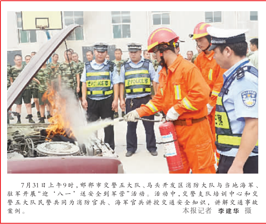
7月31日上午9时，邯郸市交警五大队、马头开发区消防大队与当地海警、驻军开展“迎‘八一’送安全到军营”活动。活动中，交警支队培训中心和交警五大队民警共同为消防官兵、海警官兵讲授交通安全知识，讲解交通事故案例。本报记者 李建华 摄

该《办法》的实施，提高了减刑、假释监督工作效率，使减刑、假释罪犯考核奖惩的事后监督转变为事前监督。