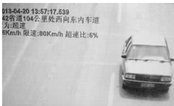
红色普桑车从县城方向驶出。(监控截图)