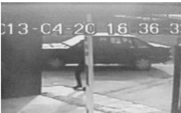
进入乡间水泥路。(监控截图)